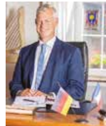
Grußwort des Bürgermeisters der Stadt Breisach

VERANSTALTER: LANDESRUDERVERBAND BADEN-WÜRTTEMBERG E.V. AUSRICHTER: BREISACHER RUDERVEREIN E.V.