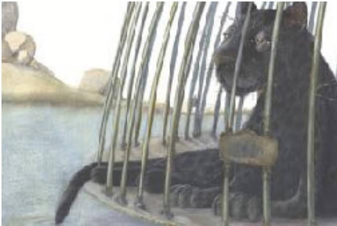
Julia Nüsch, Der Panther – Poesie für Kinder