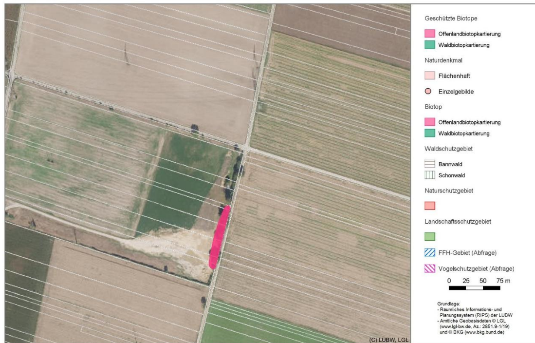
Abbildung 2: Lage der im Umkreis des Plangebietes liegenden Schutzgebiete