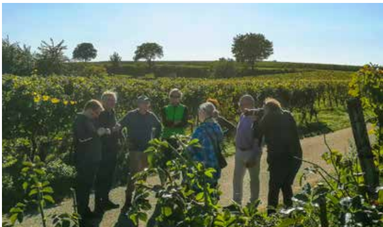
Das Bild zeigt einen Blick auf die Teilnehmer der Herbst-Pressefahrt im Tuniberg.

Zuvor lädt Tuniberg Wein erneut zu einem Herbst-Feuer am Tuniberg ein. Dieses Jahr wird die Neuauflage der Veranstaltung am Samstag und Sonntag, 15. und 16. Oktober 2022, im Bereich Attilafelsen auf Gemarkung Breisach-Niederrimsingen ausgerichtet. Auftakt ist am Samstag ab 16 Uhr und am Sonntag ist der Beginn ab 12 Uhr vorgesehen. Um 18 Uhr wird dann am Samstag das Herbst-Feuer mit Gästen angezündet. Natürlich gibt es vor Ort beste Tropfen von Tuniberg Wein; Bewirtung wird ebenfalls angeboten (u.a. mit Flammkuchen von Hitstory Food). Getränke ohne Alkohol sind natürlich auch im Ausschank. Danach folgt die Plaza Culinaria Freiburg oder der Weihnachtsmarkt Freiburg. Darüber wird Tuniberg Wein ergänzend informieren unter www.tuniberg-wein.de .