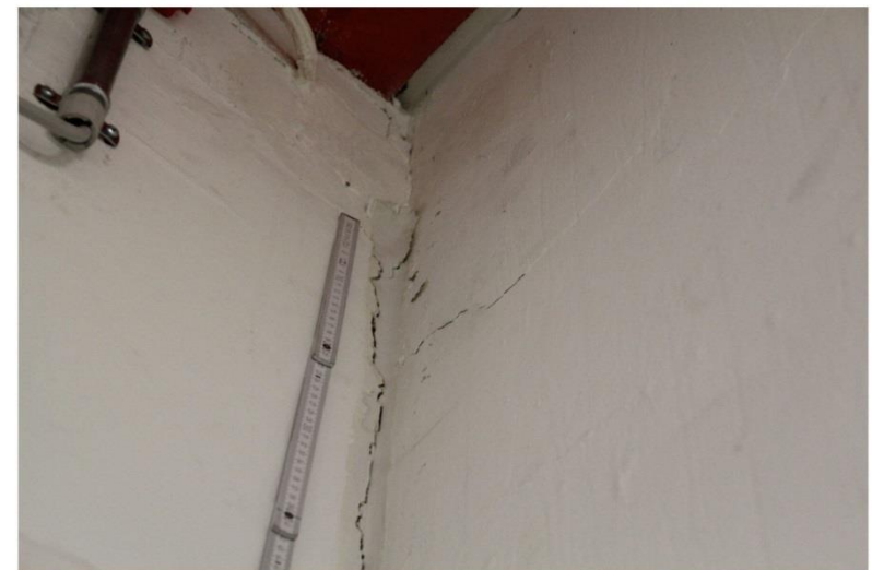
2013 | - Flur | Bild 0004