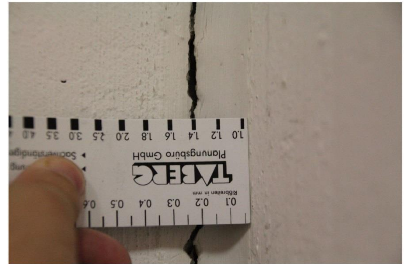
2013 | - Flur | Bild 0003